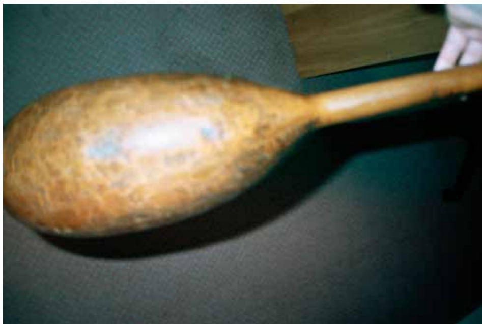
Slika 3. Oblik kutljače tambure Osmana Mušića, Zemaljski muzej u Sarajevu, inv. broj 14956/II (stari broj 1/101)

donjeg dijela kutljače su blago zaobljeni i podsjećaju na dublju drvenu kašiku, u narodu poznatu kao kutljaču.