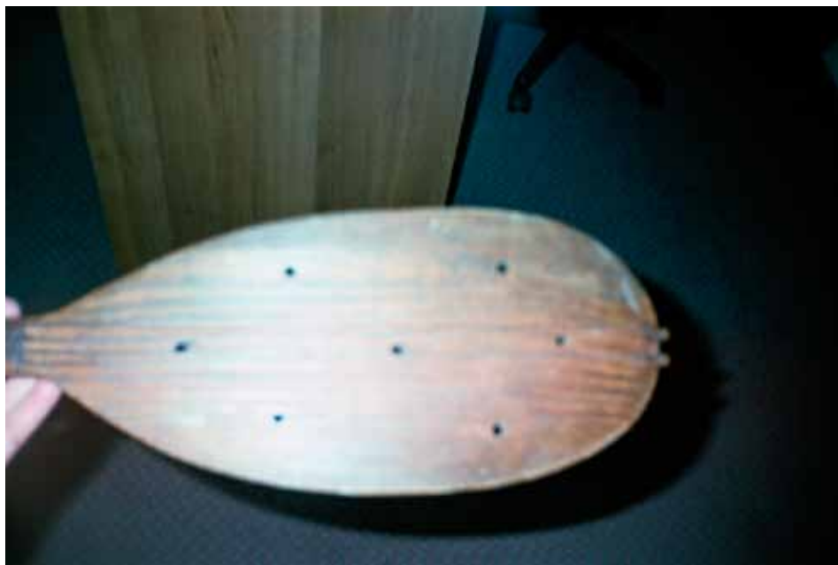
Slika 4. Daska tambure Osmana Mušića, Zemaljski muzej u Sarajevu, inv. broj 14956/II (stari broj 1/101)

zasebno, sa donje strane je bio ravan i lijepio se za vrat, a sa gornje je imao dva proreza za žice. Morao je biti onoliko širok koliko je bilo potrebno da se žice odignu od instrumenta. Niže jastuka su se postavljala tri perdeteta. Perdeteta su se pravila od drveta ili od žice. Drvena perdeteta su se lijepila za vrat, dok su se metalna omotavala ili utiskivala u vrat. Graditelji su ih postavljali na određenom rastojanju koje se određivalo po sluhu ili prema uzorku mjera.