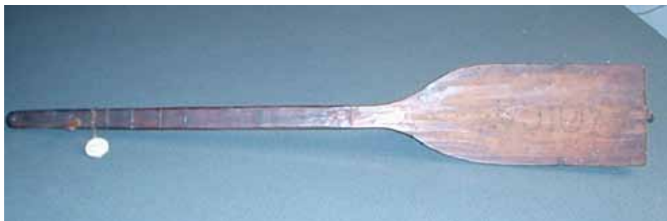
Slika 5. Tambura sa dvije žice, eksponat Etnografskog muzeja u Zagrebu, etn.zb. 8187, Bosna

Zvuk na tamburi sa dvije žice dobivao se okidanjem žica pomoću terzijana. Prije nego počne svirku, svirač ugađa ili dogoni obje žice na istu visinu. Ugađanje tambure sa dvije žice se vršilo po sluhu. S obzirom da su sve tambure sa dvije žice imale samo tri perdeteta, mogao se izvesti sljedeći tonski niz: