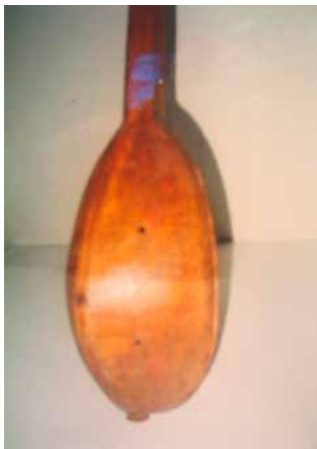
Slika 2. Kutljača tambure s dvije žice Osmana Mušića, Zemaljski muzej u Sarajevu, inv. broj 14956/II (stari broj 1/101)

žice i dovode do napetosti kojom se ostvaruje željena visina tona. Jedna čivija se postavlja sa gornje, a druga sa prednje strane instrumenta.