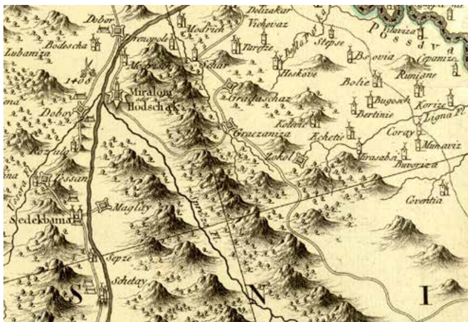
■ GRAČANICA NA KARTI M. SCHIMEKA IZ 1788.

parmakluk (palisade) na tvrđavi u Građačcu. Sličan arz je uputio i tadašnji bosanski namjesnik Ahmed-paša, pa je Porta – nakon provjere podataka i uvida u odgovarajuće deftere, koji su potvrdili navedene podatke – izdala uredbu po kojoj se Srebrenik mora vratiti u okvire Građačačke kapetanije ( Maliye def̄t. , B-174-2).