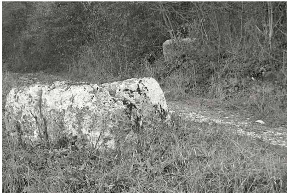
Sl. 2. Stećci na lok. Krčevine