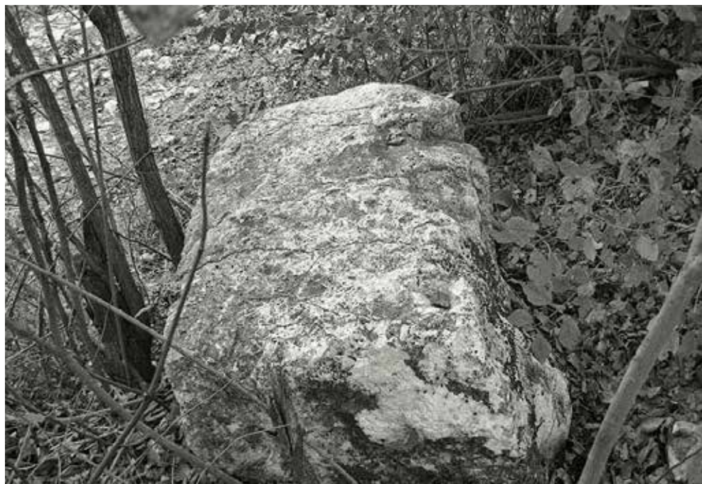
Sl. 5 – Prevrnuti sljemenjak, istočna – oštećena strana