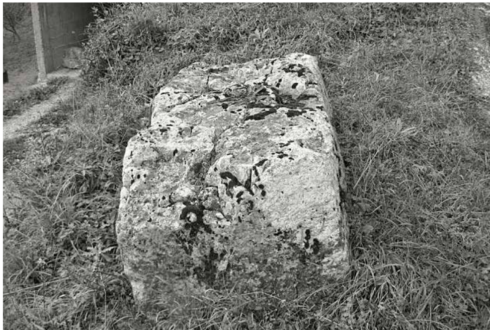
Sl. 3 – Sanduk, istočna strana