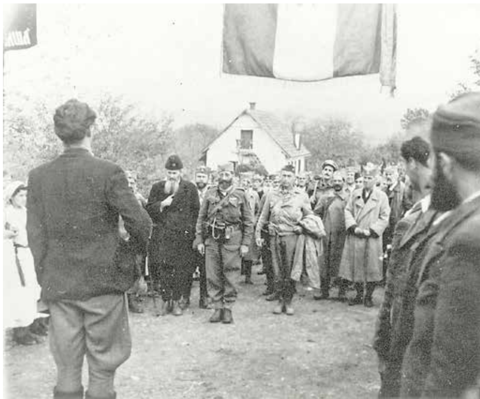
Draža Mihajlović na Trebavi, 1945.

dokumenata koji vrlo ilustrativno oslikava stvarno stanje u Gračanici, iza linije fronta, kakvo je, manje-više bilo u svim mjestima na pravcu nastupanja krupnih jedinica NOVJ u operacijama za konačno oslobođenje zemlje.